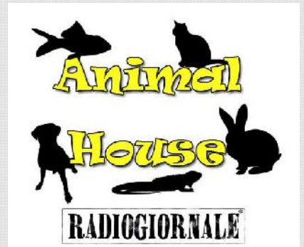
Animal House, la rubrica RG sul Mondo Animale