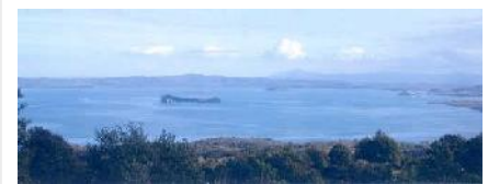
Associazione Lago di Bolsena